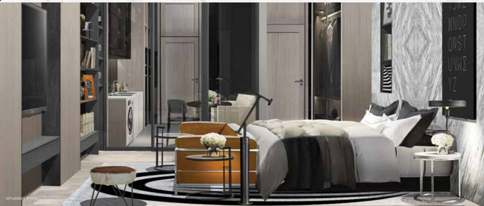
ONE BED ROOM : 26.40 SQ.M.

Life is more wide open when you maximise your unique space with full ceiling height window and a full-length balcony.