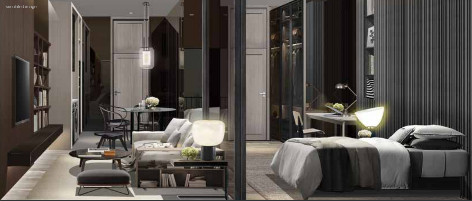
ONE BED ROOM : 34.80 SQ.M.